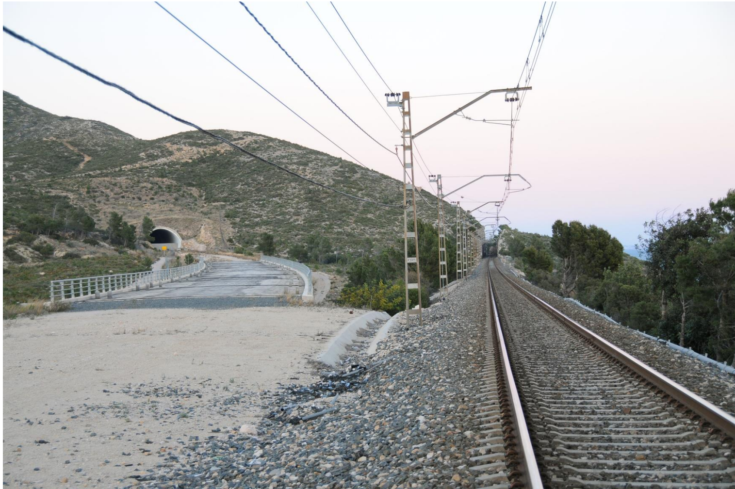
Corredor Ferroviari del Mediterrani. Província de Tarragona. Febrer de 2011. Prats i Camps.